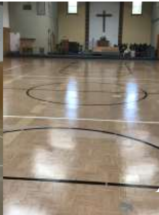
After the Wax