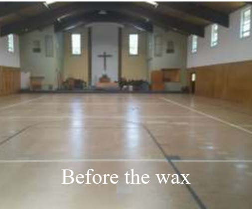
Before the wax