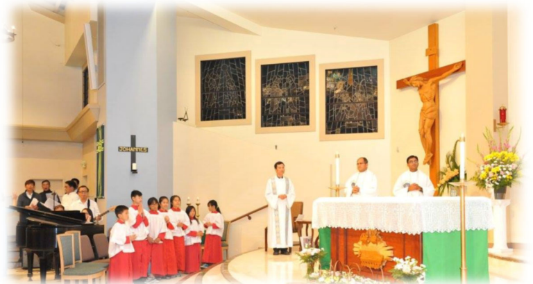
OLOG Community celebrating Fatima Centennial